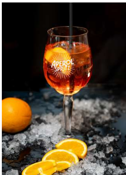
Aperol Spritz 9,00 €