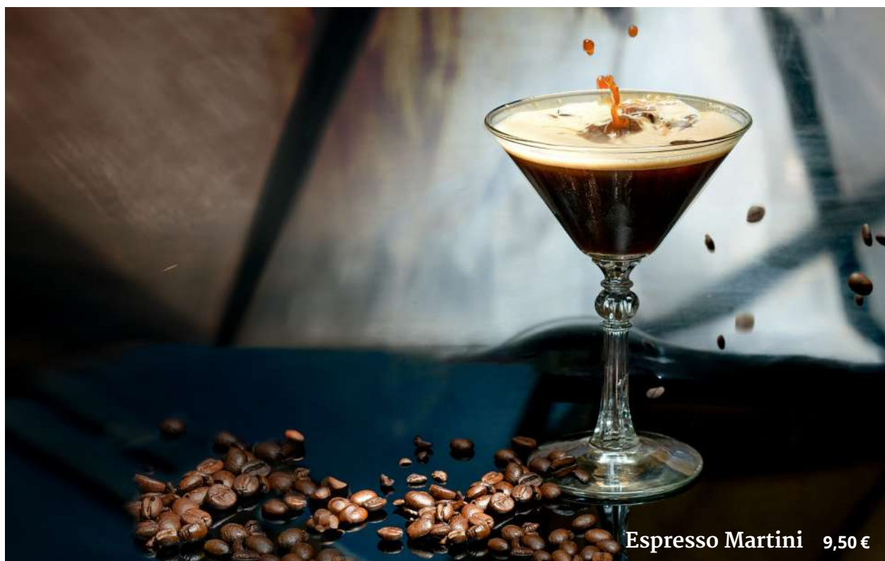
Espresso Martini 9,50 €