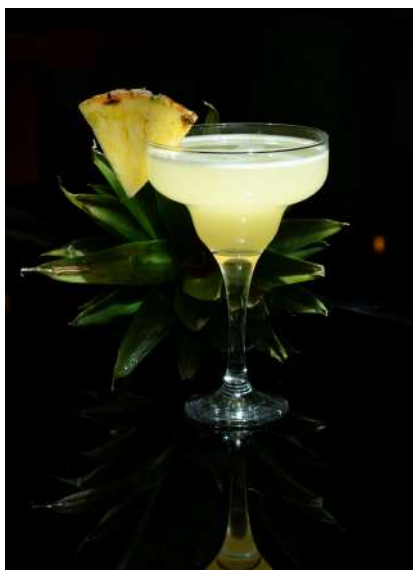
Daiquiri 10,50 €