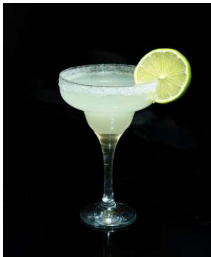
Margarita 9,50 €