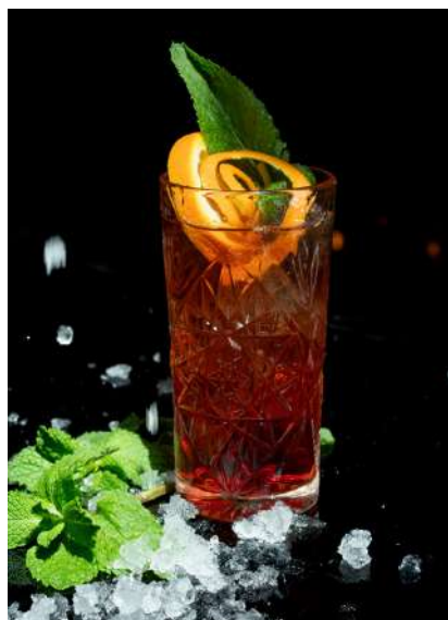
Americano 9,00 €