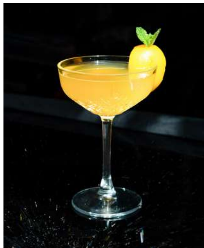
Bellini 8,00 €