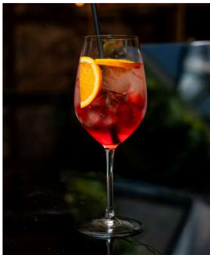
Campari Spritz 9,00 €